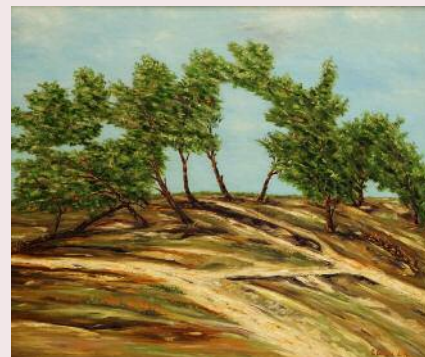
Na brehu, 2014, olejomalba (Prof. MUDr. Ľudovít Gašpar, CSc.)