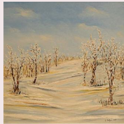
Po snežení, 2015, olejomalba (Prof. MUDr. Ľudovít Gašpar, CSc.)